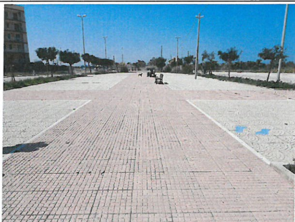
AREA VERDE "A"